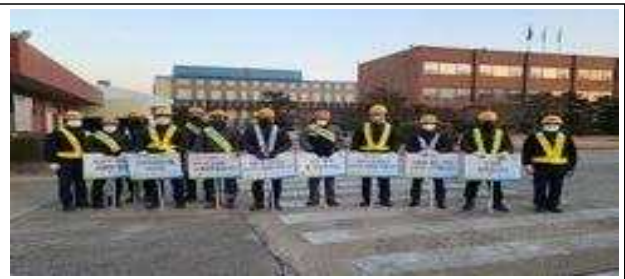
협력업체 합동 안전보건 캠페인