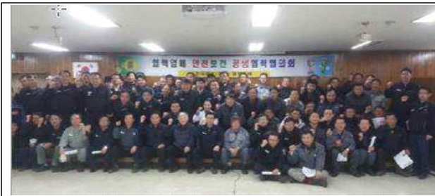
상생협력 프로그램 발대식